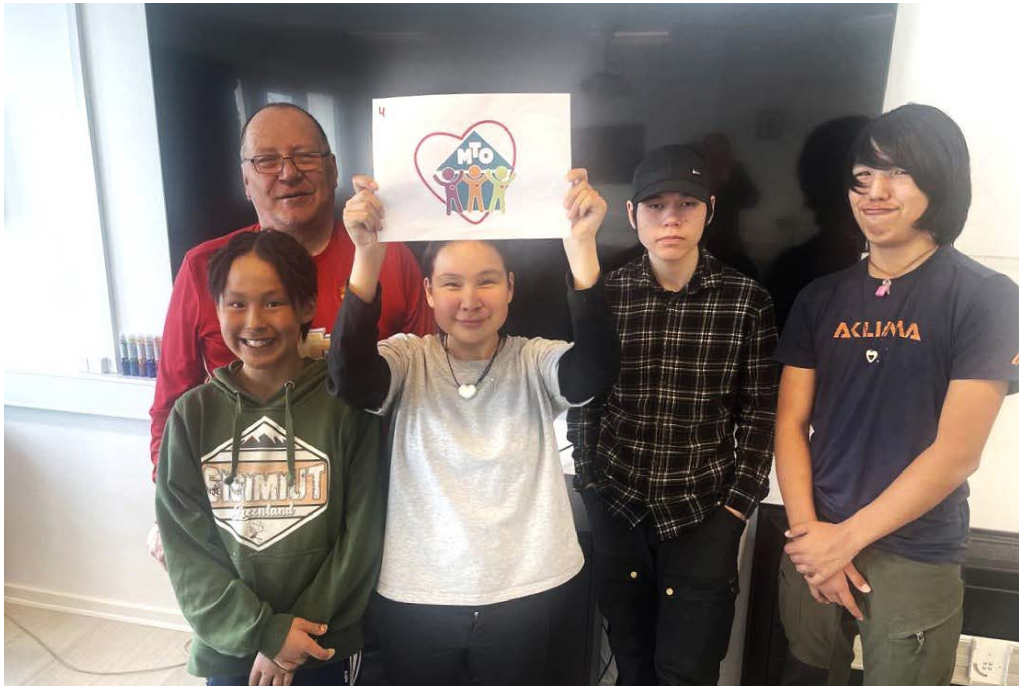
Meeqqat Oqartussaaqataasuisa meeqqat toqqissillutik ornittagaat MTO isumassarsiaaraat – taakkuuppullu aamma atissaanik ilisarnaatissaanillu isumassarsisut. Assimi takusinnaavasi ilisarnaat naammassimmat tulluusimaarlutik takutikkaat. Theodorap (titartakkamik tigumminnittup) titartarpaa.