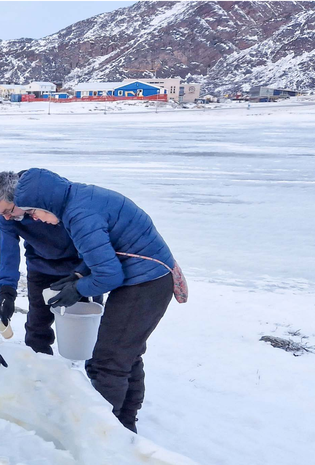
Meeqqat Oqartussaaqataasui aallartikkamilli sammisaqaqatigiittarput, uani apummik illuikkiortut.

Børnedemokraterne har arrangeret mange aktiviteter. Her er de i gang med at lave en iglo.