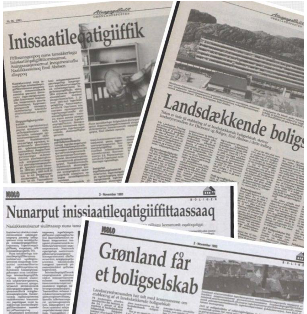
Taamani inissiatileqatigiiffik pilersinneqartussanngormat tusagassiutitigut qulaajarneqangaatsiarsimavoq.

Pilersinneqarnerminiilli INI malunaatilimmik ineriartuuteqarsimavoq. Suliffeqarfik 17-inik immikkoortortaqqarpoq kommuninut agguataarsimasunik. Ullumikkut INI arfinilinnik saaffiginnit-tarfusunik allaffeqarpoq, INImut-imik taaguutilinnik, tassanilu najugaqartut ornigullutik saaffiginnissinnaapput. Tamatuma saniatigut INI-mut e-mailikkut saaffiginnittoqarsinnaavoq, imminullu kiffartuussivikkut najugaqartut inissar-