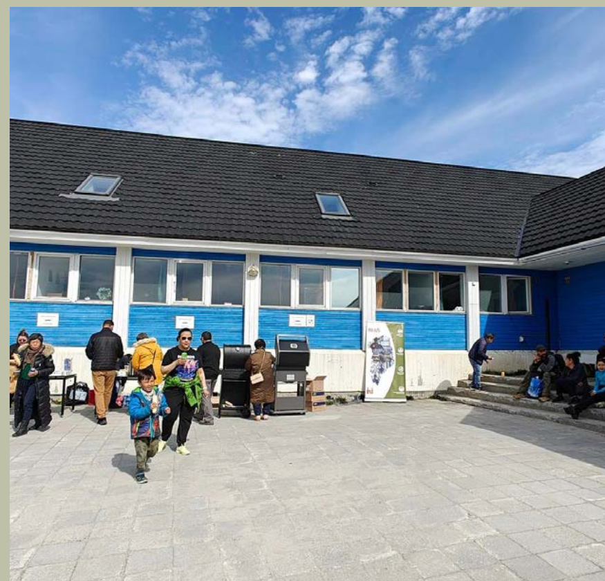
Aasianni Saliineq ingerlanneqarmat Aasiammerit peqataalluarput.

Følgende byer gennemførte dette år Saliineq: Sisimiut, Maniitsoq, Aasiaat og Nuuk.