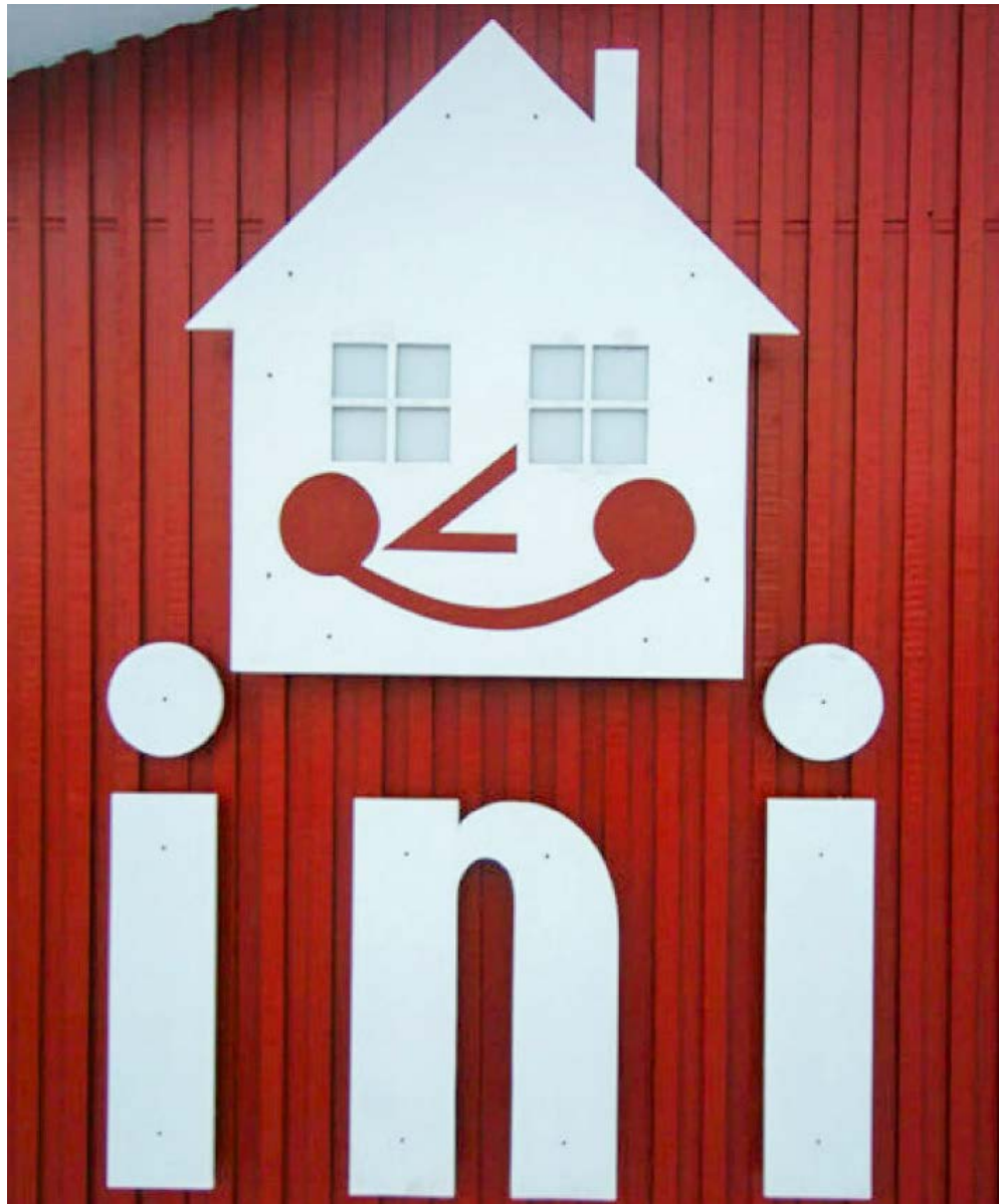
INI-p logo-toqanngua qungujulasoaq puigussanngilarput, maannakkulli ullutsinnut tulluarsakkamik ilisarnaateqalernikuuvugut.

To år senere, i maj 2016, ændrede virksomheden navn til »INI A/S« som et led i en modernisering af virksomheden. Samme år, den 29. august, lancerede