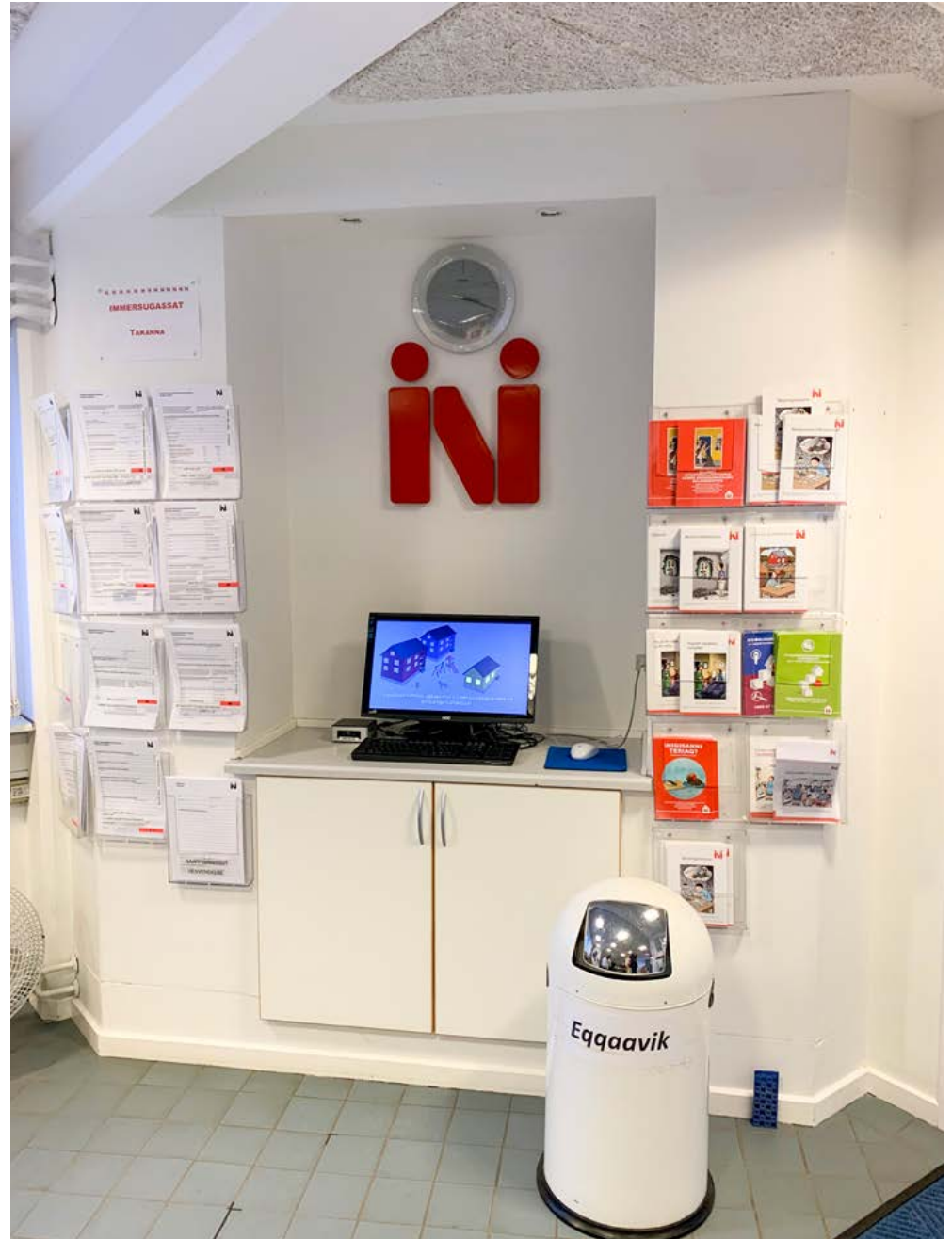
Sullitat tamaasa periarfissilluarumallugit aammattaaq ornigulluni saaffiginnittarfinni Imminut Kiffartuussivitsinnut atorneqarsinnaasunik qarasaasiaqartarpoq.

Vi skal ikke glemme INIs gamle smilende logo. I dag bruger vi dog et logo, der er tilpasset moderne tider.