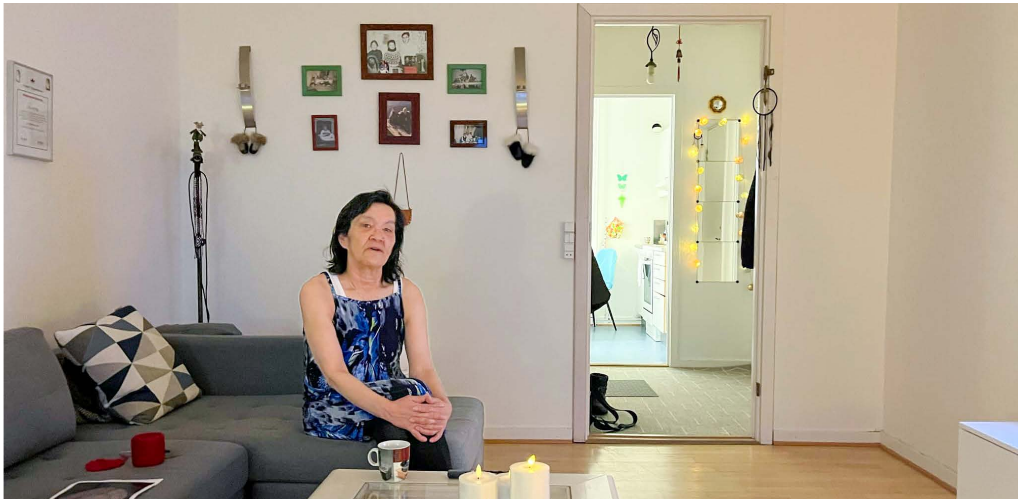
Raket Broberg Blok 16-imi angertarsimaffimmini nuannarisamini.