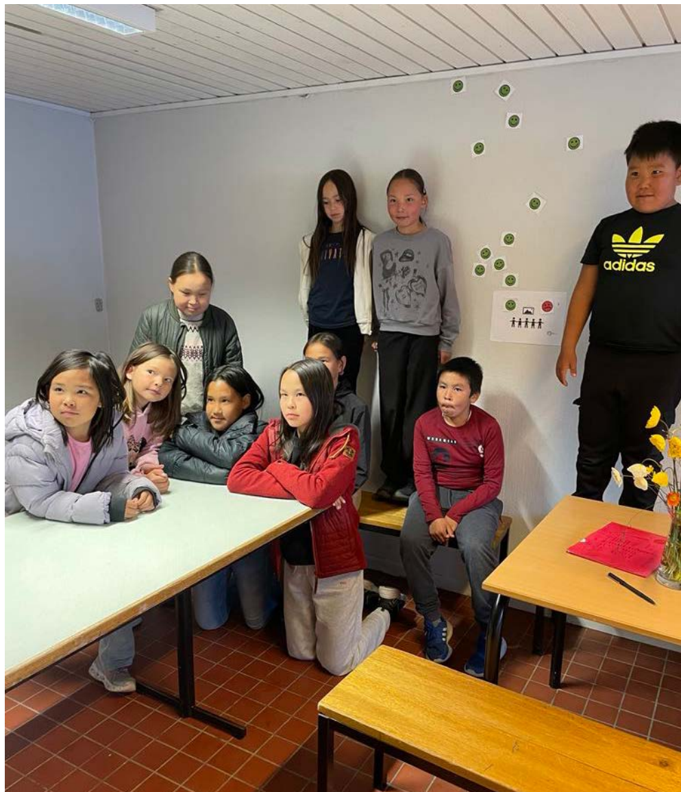
Qaqortumi Meeqqat Oqartussaaqataasui nutaat, ukioq manna aallartittut.

MTO er blevet til blandt andet i samarbejde med Qeqqata Kommunia og Østifterne.